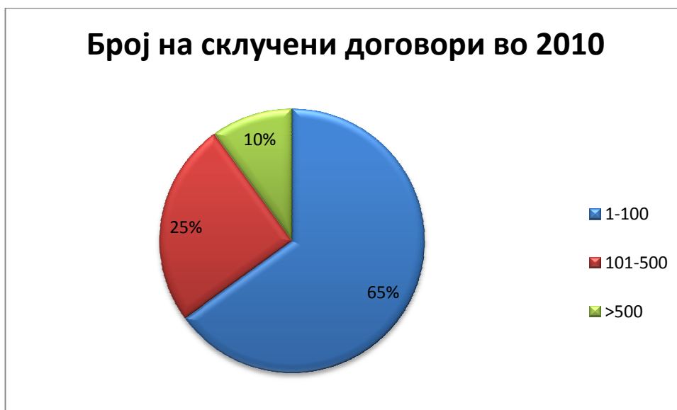
Слика 4: Просечен број на склучени договори по испитаник во 2010

Сите склучени договори се со траење од една година и се со сезонски карактер.