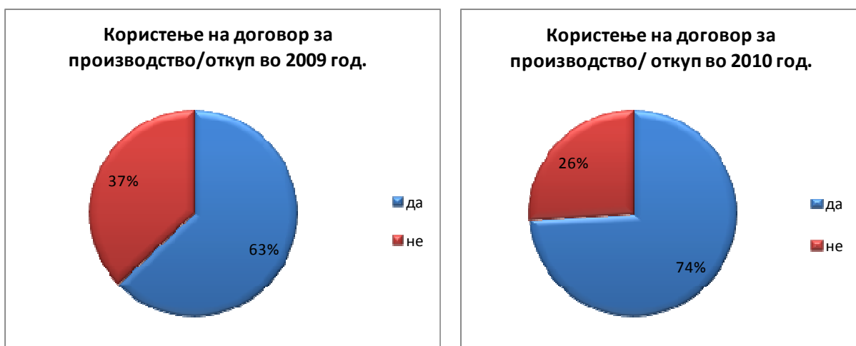
Слика 1: Користен договор за производство / откуп на земјоделски производи во 2009 и 2010

Седум претпријатија не практикувале договори за откуп во текот на 2010 година од кои 2 се винарски визби, 1 преработувач и 4 трговци.