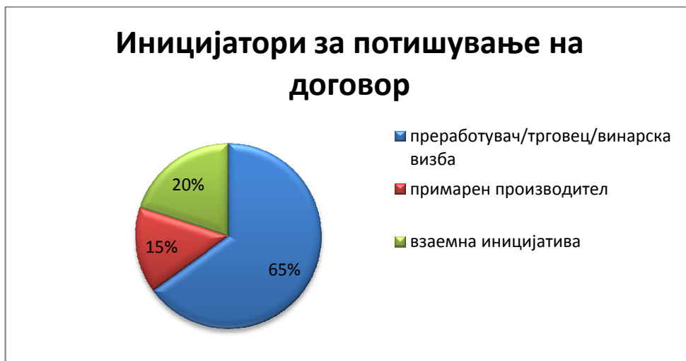
Слика 3: Иницијатори за потпишување на договори за откуп

Најголемиот број од испитаниците (13) склучиле повеќе од еден а помалку од 100 договори со нивните добавувачи, 5 склучиле помеѓу 101 и 500 договори, додека само две претпријатија (винарски визби) склучиле повеќе од 500 договори во 2010 година и тоа еден од испитаниците навел 1.000 а другиот 1.200 склучени договори во тековната година.