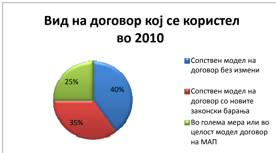
Слика 2: Вид на договор за производство користен во 2010

Прашани дали во моделот на договори кои го користеле во оваа откупна сезона во целост се вметнати барањата од новата законска регулатива, седум од анкетираниите кои направиле усогласувања на нивниот модел на договор, се изјаснија дека во поголем дел, но не во целост ги примениле сите законски барања, исто како и петте претпријатија кои користеле договорен модел на МАП. Имено, поголемиот дел од претпријатијата кои спаѓаат во гореспоменатите групи (7 од нив), не ги навеле фиксните откупни цени, додека неколку од нив не ги навеле точните услови за плаќање предвидени во законската регулатива.